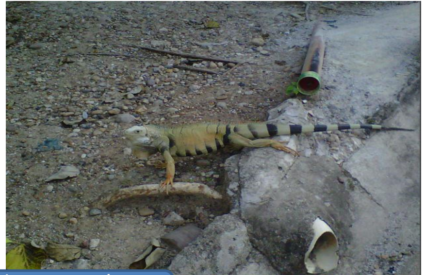
Recursos naturales de la institución