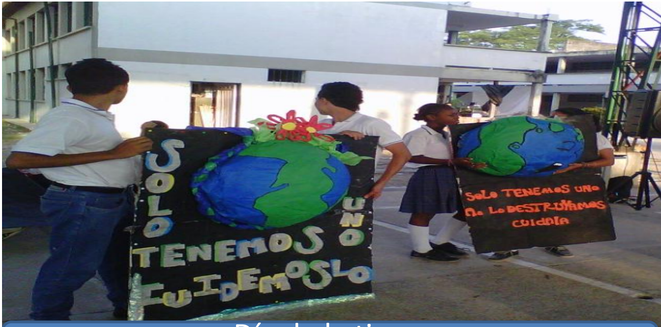
Día de la tierra