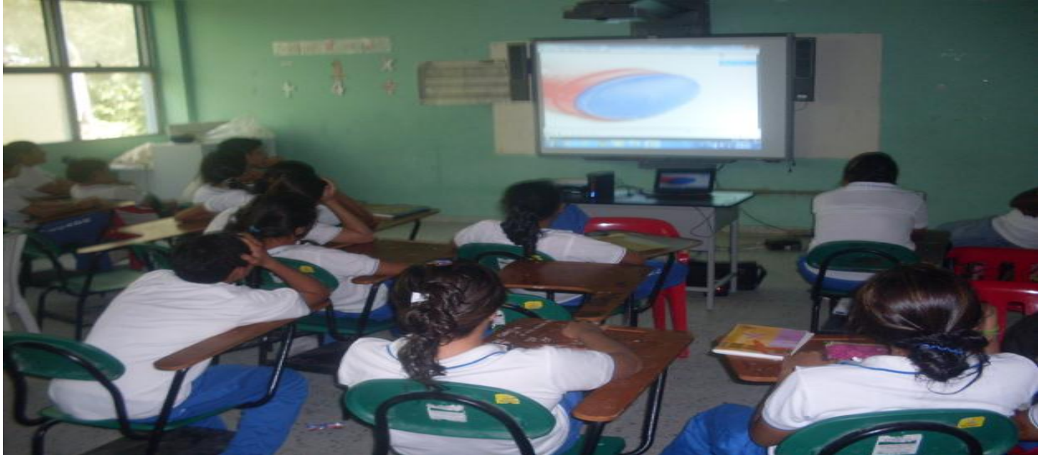
Así se celebró en día internacional del medio ambiente en la I.E.C.A.D.R