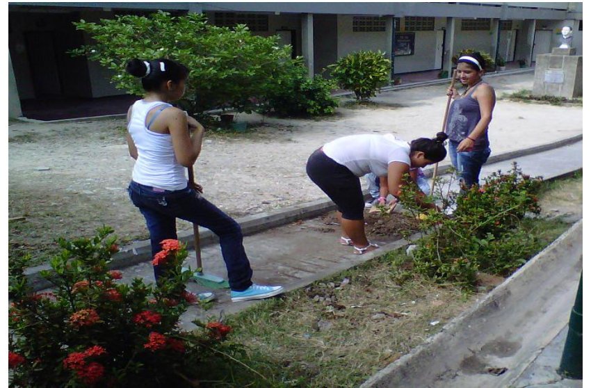
Actividades de ornamentación y/o jardinería - 2013